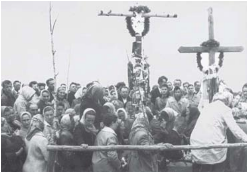
Zgromadzenie w miejscu domniemyanych objawień

Niewyjaśnione zjawiska zawsze wywoływały duże zainteresowanie wśród ludzi. Często upatrywano w nich znamiona cudu. Nie wszystkie udało się dokładnie zbadać. W Polsce Ludowej trudność wynikała między innymi z panicznych wręcz reakcji władz komunistycznych wobec wydarzeń o charakterze religijnym. Z powodów ideologicznych starały się one jak najszybciej usunąć przedmioty kultu z miejsc publicznych. Czasami dochodziło do użycia siły w stosunku do gromadzących się osób. Właśnie taki charakter miały działania podjęte wobec wiernych zebranych w Zabłudowie w powiecie białostockim.